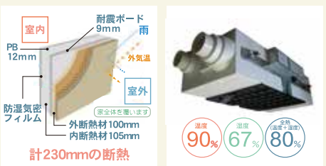
ダブル断熱 熱交換換気システム