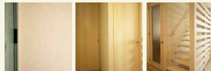
ぬりかべ仕様 オリジナル建具 オリジナル無垢階段

ひのきの柱・梁を室内に出す真壁づくりを標準仕様としています。ひのきの香りや木目による癒しの効果、また木の吸放湿性能による室内空気環境の浄化作用など、健康的な空間づくりには最適な仕様となっています。 また、構造体である梁を室内に出すことで、天井が高く（標準 2.4m⇒2.68m）なり、より開放的な空間づくりが可能となります。