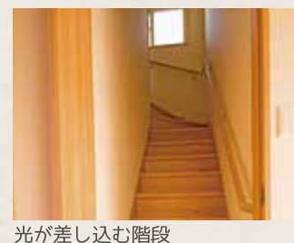
光が差し込む階段