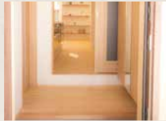
無垢のぬくもりで迎える玄関